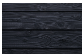
#331 ebony (Int/Ext)