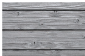
#112 silver grey (Int/Ext)

Transparente/helle Pigmentierungen ohne UV-Blocker (wie #101 und #121) lassen Gendai in den ersten Monaten aufhellen.