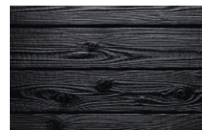
#132 ebony (Int/Ext)