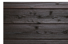
#121 light oak (Int/Ext)

Transparente/helle Pigmentierungen ohne UV-Blocker (wie #101 und #121) lassen Gendai in den ersten Monaten aufhellen.