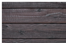
#101 transparent (Int/Ext)